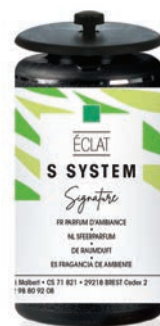
« S » SYSTEM Cartouches 25 mL Éclat