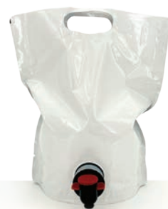
RECHARGE Éclat 1 L