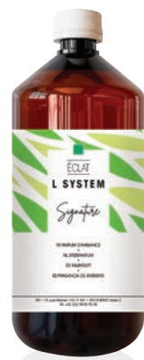
« L » SYSTEM Recharges 1 L Éclat