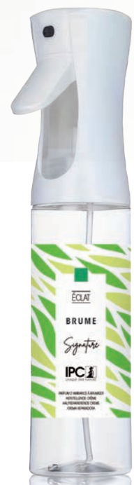
BRUME 270 mL Éclat

Gamme « L » • « M » • « S » SYSTEM Diffuseurs de vapeur sèche