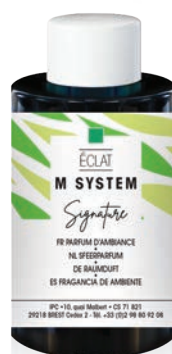
« M » SYSTEM Cartouches 100 mL Éclat