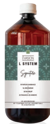
« L » SYSTEM Recharges 1L Évasion