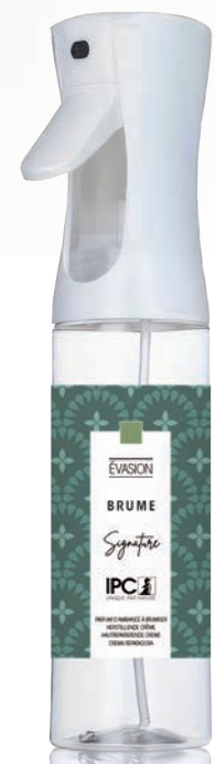
BRUME 270 mL Évasion

Gamme « S » • « M » • « L » SYSTEM Diffuseurs de vapeur sèche