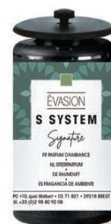
« S » SYSTEM Cartouches 25 mL Évasion