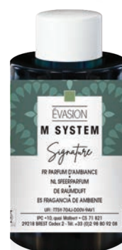
« M » SYSTEM Cartouches 100 mL Évasion