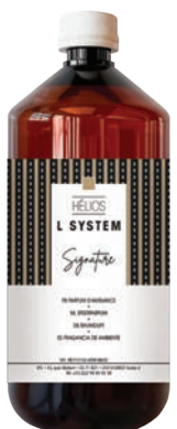
« L » SYSTEM recharges 1 L* ONE I et Hélios

* Recharge 5 L uniquement disponible pour le parfum One