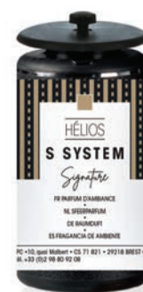
« S » SYSTEM Cartouches 25 mL ONE I et Hélios