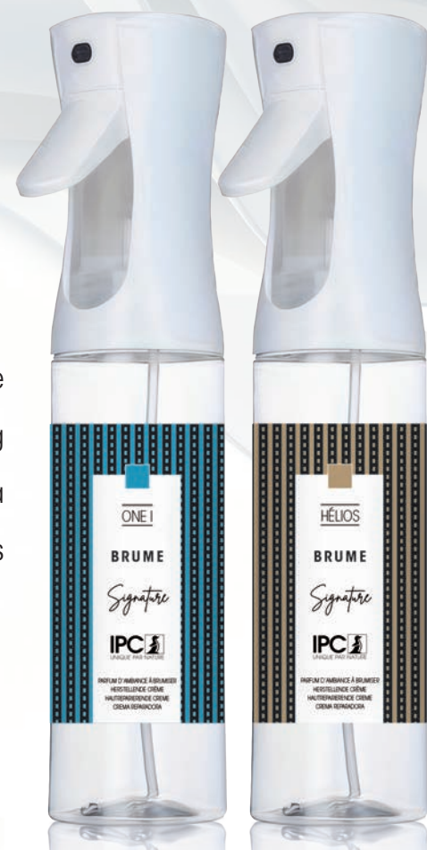
BRUME 270 mL ONE I et Hélios