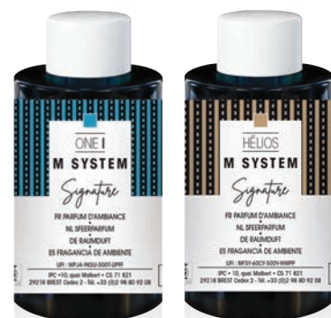
« M » SYSTEM Cartouches 100 mL ONE I et Hélios