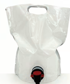
RECHARGE ONE I et Hélios 2,2 L