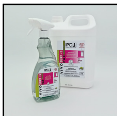
Foto de contractul