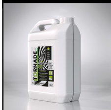
Foto de contractul