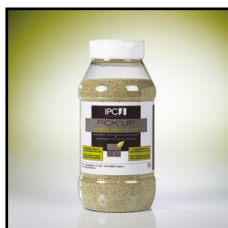
Foto de contractul