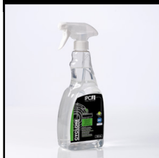
Foto de contractul