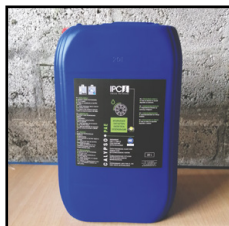
Foto de contractul